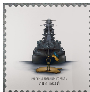
Ілюстрація з конкурсу Укрпошти на найкращий ескіз поштової марки https://cutt.ly/FSPхурк

Варто уникати участі у малокорисних заходах з підвищення кваліфікації викладачів, зокрема тих, що обмежуються оформленням сертифіката учасника. Фейкові міжнародні стажування, не пов'язані із особистим відвідуванням іншої країни, мають піти шляхом руського корабля.